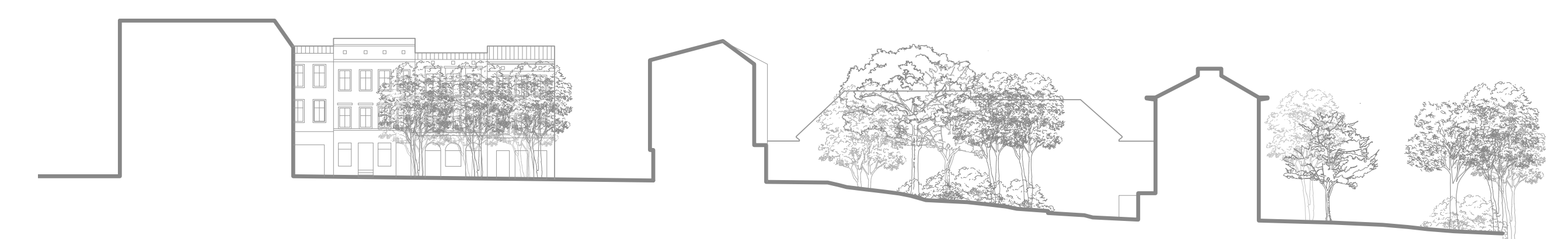
Schemat przekrojowy dla kwartału mieszkalnego

Tkanka Starego Miasta Mysłówice składa się z mniejszych, zwartych zespołów kamienic, okalających, zazwyczaj, zielone dziedzińce. W tym kontekście zaprojektowana została architektura kontynuująca kwartałowy charakter miasta, której zielone centrum stanowi wspólny dziedziniec. Zabudowa ściśle przylega do istniejących na tym terenie budynków tym samym domykając północno-wschodnią ścianę rynku i naśladowując organiczną linię zabudowy kamieniczek niegdyś tam stojących. Niegdyś płynąca tam rzeka, podkreślona została poprzez delikatne zagięcie budynku.