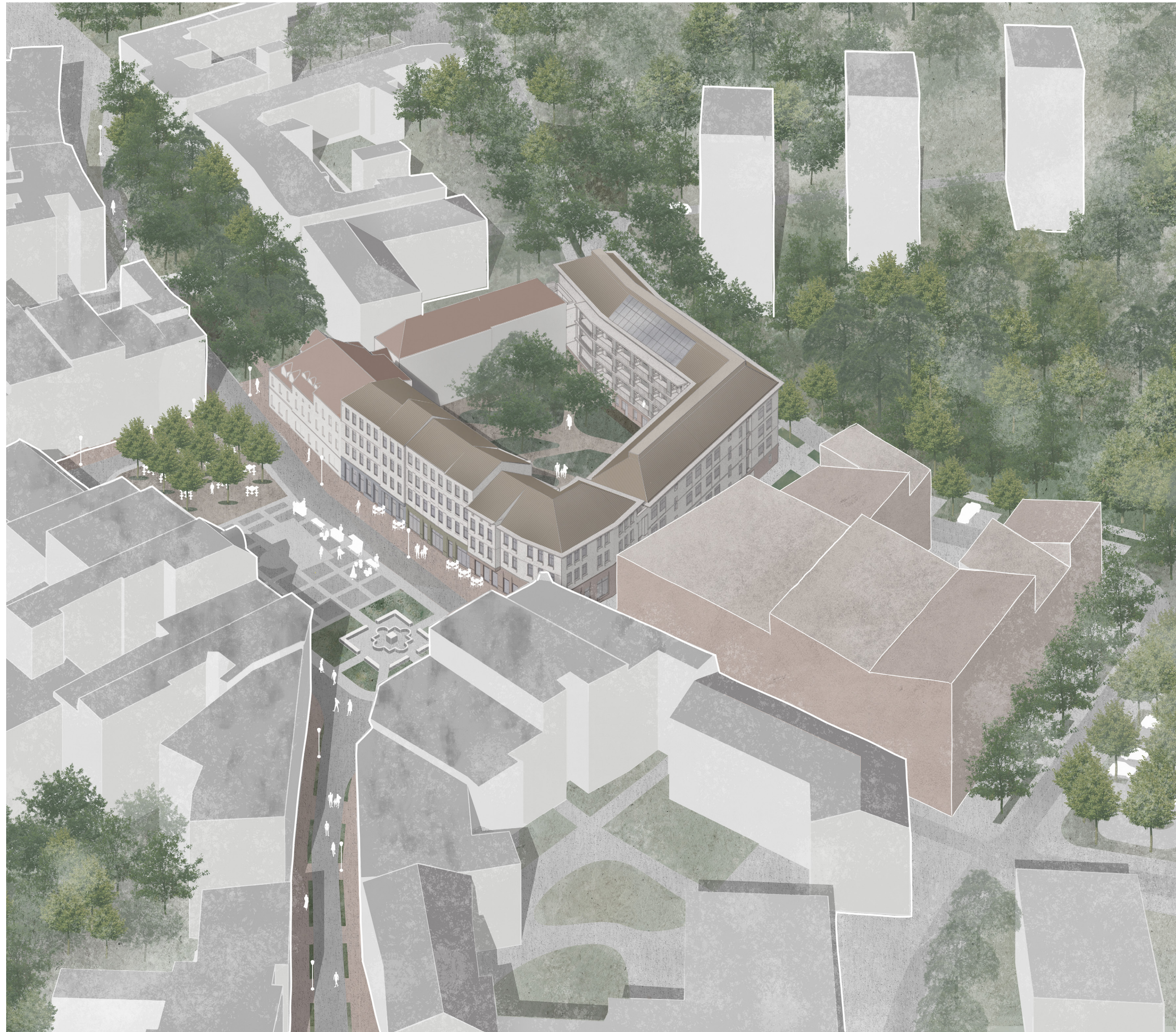
Kwartal mieszkalny wraz z planowanym obiektem kultury domykającym ul. Kaczej.